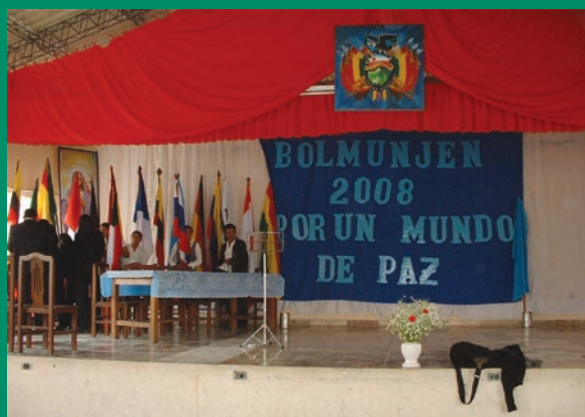
BOLMUNJEN: Imitación de la Asamblea General de Naciones Unidas

El pasado martes 30 de Septiembre, la unidad educativa parecía transformada por un aire de responsabilidad y concentración en general. Los jóvenes lucían ropa formal y las señoritas estaban lindas como siempre y aún más. El plantel de los docentes demostró su característica mancomunidad y uno se sentía muy a gusto, rodeado de gente con un objetivo concreto y participativo. La inauguración del BOLMUNJEN 2008